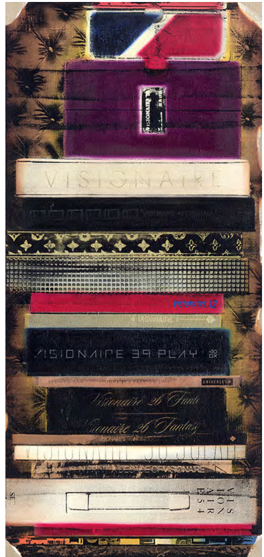
Artbooks YM-01 2012 Original h1135 x w530 mm Silkscreen and Oil on Canvas