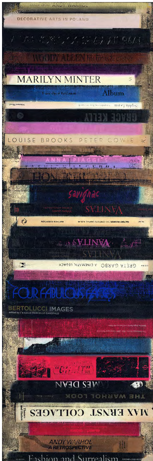
Artbooks JS-11 2012 Original h1500 x w500 mm Silkscreen and Oil on Canvas